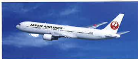
※詳しくは裏面(「Wチャンス賞」に関する注意事項)をご覧ください。